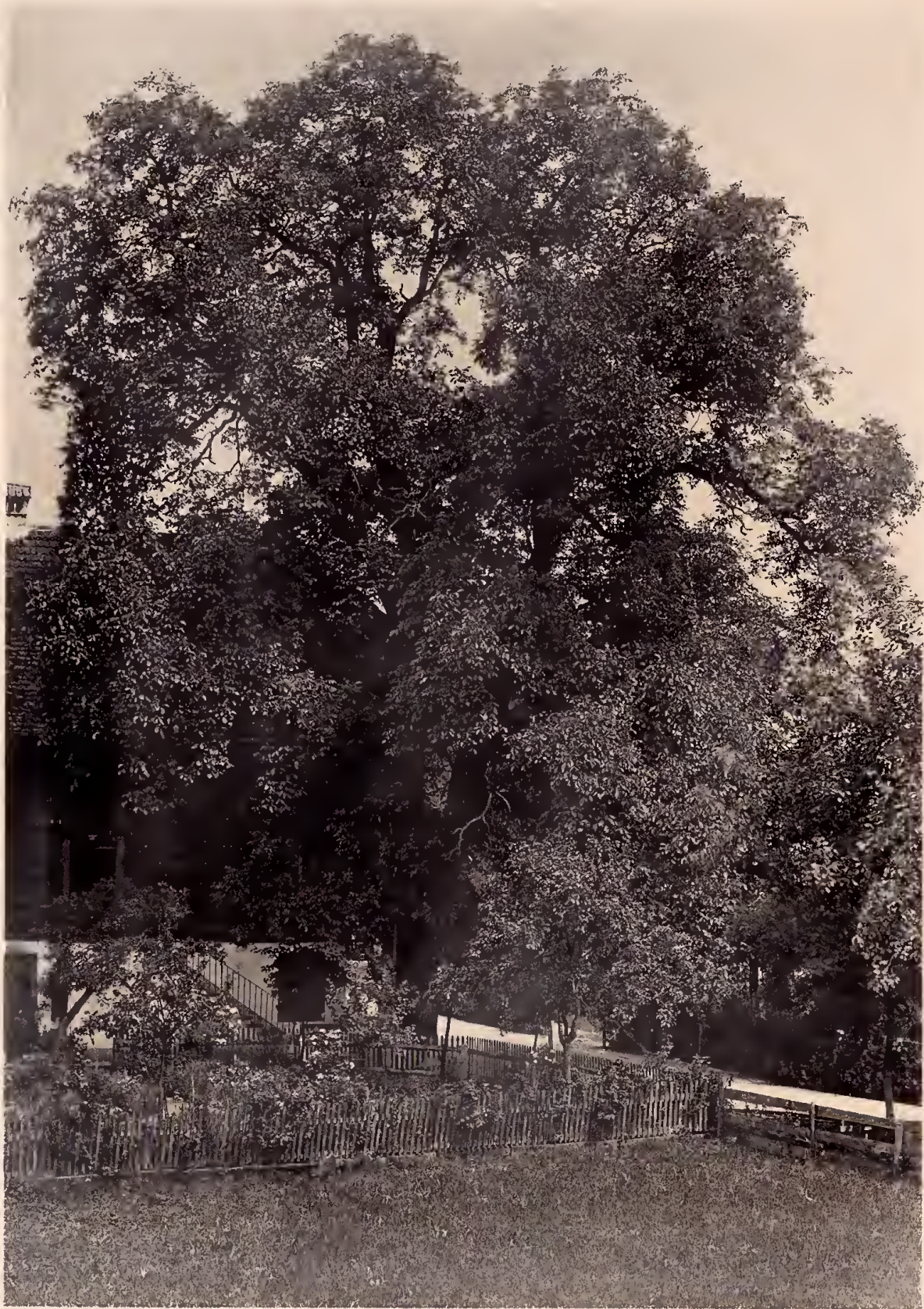
Lichtdruck: Polygraphisches Institut A.-G., Zürich